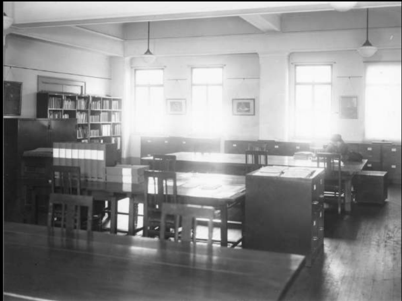
資料閲覧室 Library in the Institute of Art Research