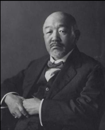
黒田 清輝 KURODA Seiki