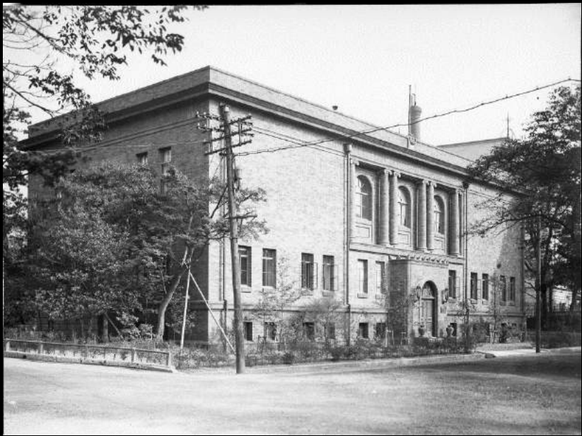
帝国美術院附属 美術研究所 The Institute of Art Research