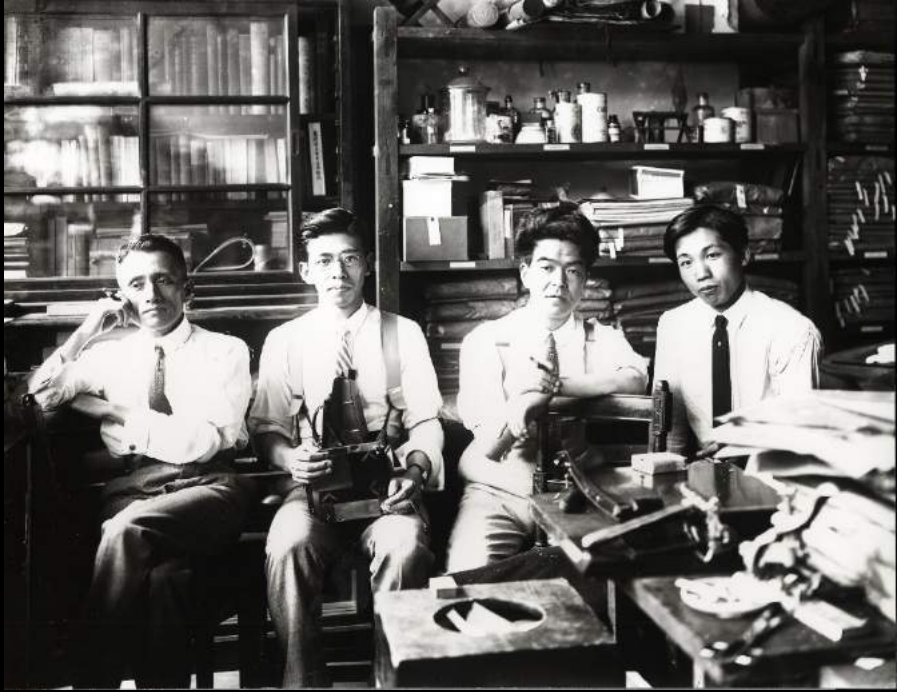
美術研究所のメンバー Member of the Institute of Art Research